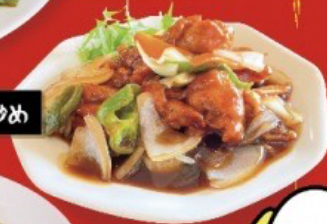
若鶏と野菜の黒酢炒め