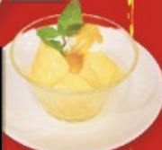
感じる果実のなめらかマンゴープリン