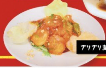
ブリブリ海老のチリソース炒め