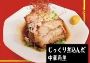
じっくり煮込んだ中華角煮