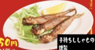
子持ちししゃもの燻製