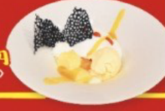
背徳のデザート盛り <パフェの再構築>