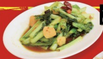
青菜のピリ辛にんにく炒め