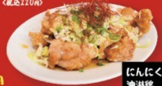
にんにく香る油淋鶏