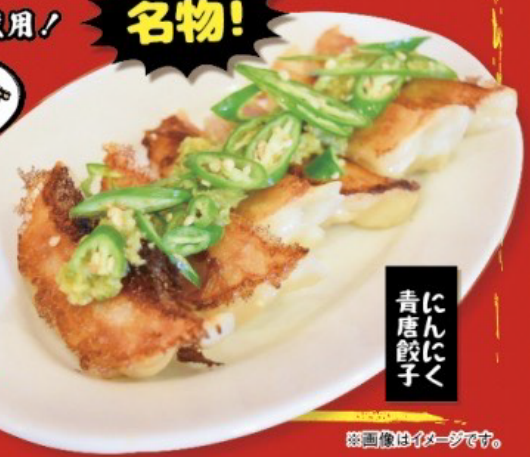
にんにく 青唐餃子