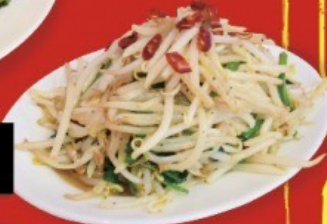
盛り盛り! ニラもやし炒め