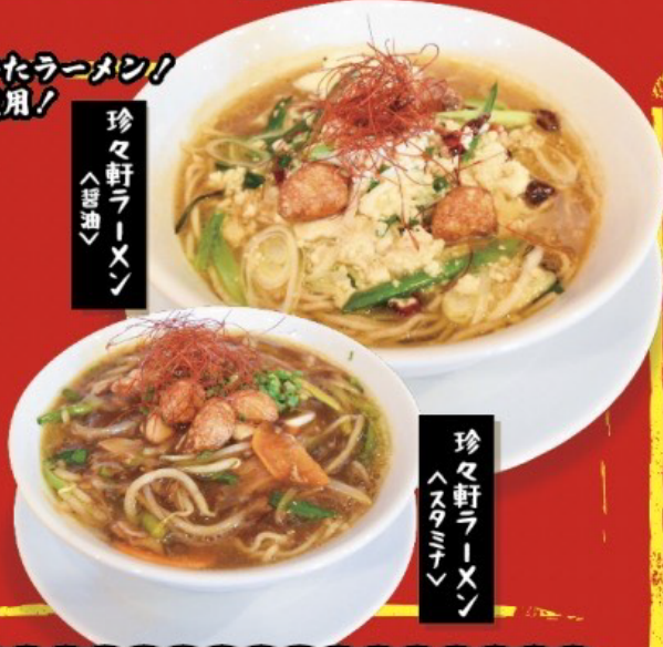
珍々軒ラーメン 〈醤油〉