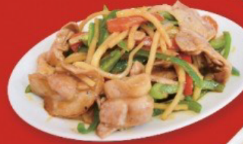
豚とピーマンのオイスター炒め