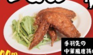
手羽先の中華風唐揚げ