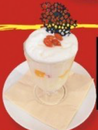
至福のふわふわ杏仁